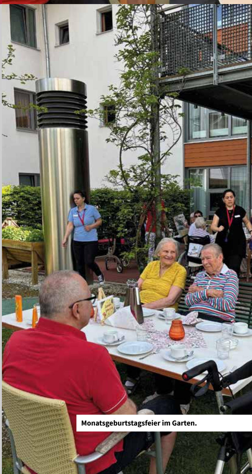
Monatsgeburtstagsfeier im Garten.